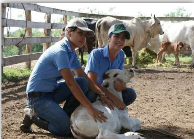
Estudiantes de la Universidad Nacional de Agricultura