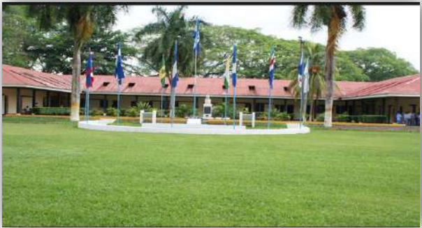
Foto. Plaza de las Banderas, Universidad Nacional de Agricultura